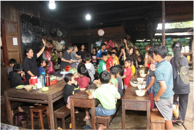
thăm Mái ấm Betania