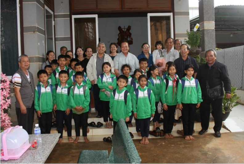
lưu niệm cùng các cháu mồ côi cơ nhờ tại Mái ấm Betania