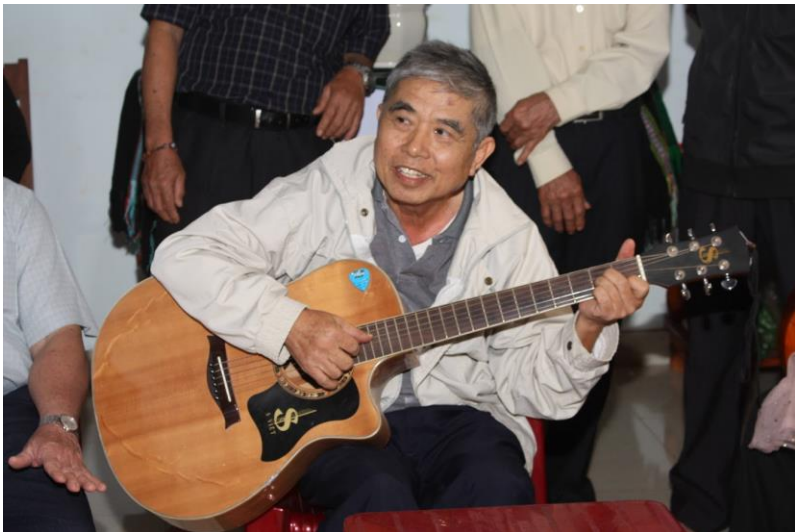
tâm tình tri ân cảm tạ Thiên Chúa

Mùng 29 năm Hồng ân Linh mục, kính chúc Cha Giuse luôn luôn hạnh phúc trong tâm hồn, trong tình yêu Chúa, trong tâm tình tri ân cảm tạ, trong mọi hoàn cảnh và trong suốt cuộc đời.