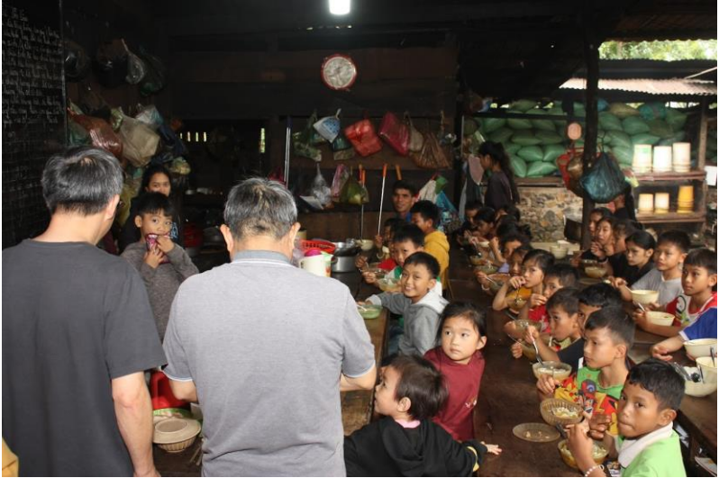
thăm Mái ấm Betania