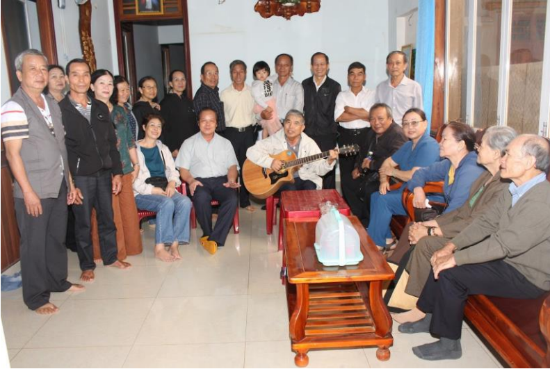
Sum họp trong ngày vui 29 năm linh mục của cha Giuse

mãi đến ngày sau cùng ". (Tâm sự cha Cầu ngày 19.11.2024 - thứ Ba sau CN33TN).