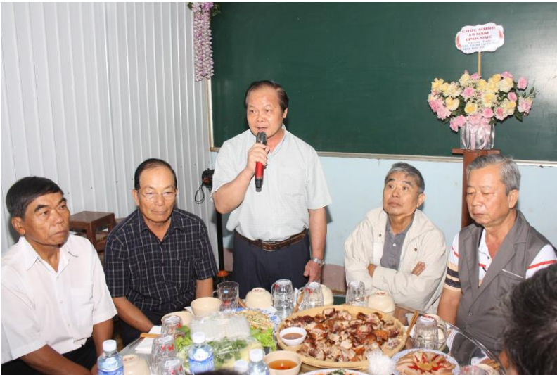
tâm tình chia sẻ của anh em lớp Truyền Tin