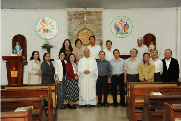
Ghi chép của BBT