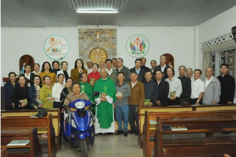
anh em LBT chụp hình lưu niệm sau Thánh lễ