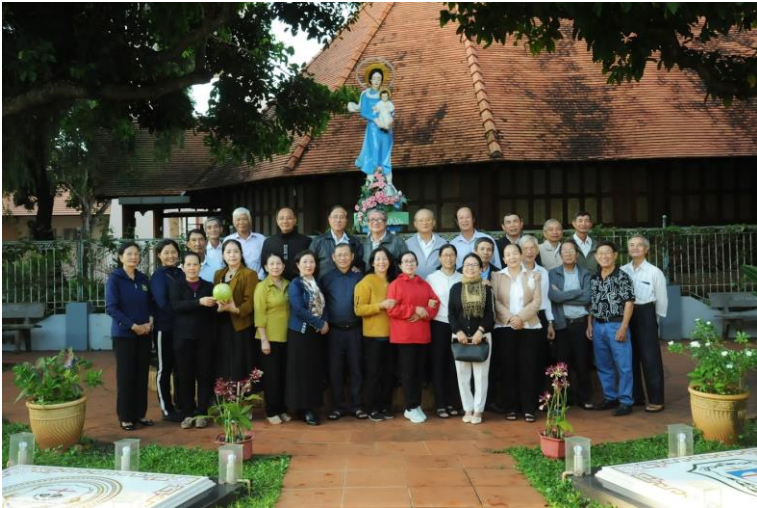
anh em LBT chụp hình lưu niệm tại phần mộ hai Đức Cha Giuse