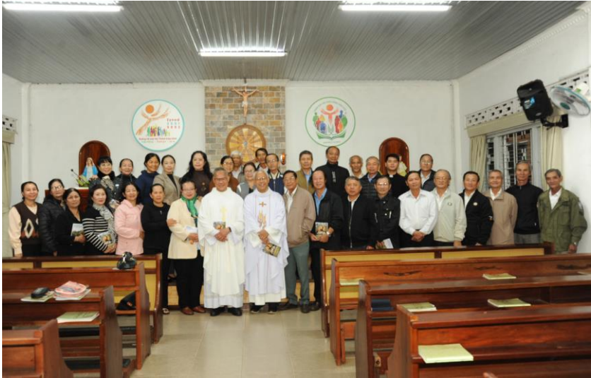
Thánh lễ tháng 12.2024