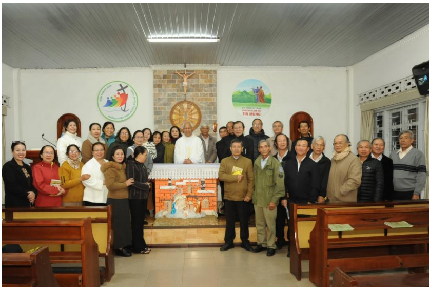
Thánh lễ tháng 01.2025