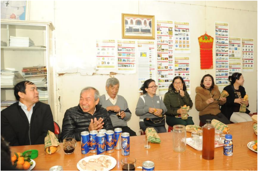
Gặp nhau cuối năm